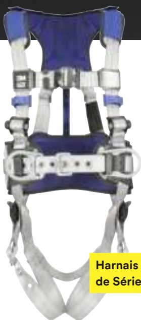
Harnais ExoFit MC de Série X100