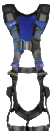
Ascension pour l'industrie générale*