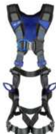
Ascension/positionnement (énergie éolienne)*