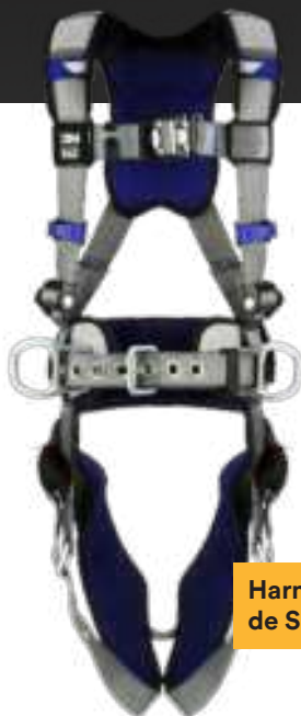
Harnais ExoFit MC de Série X200