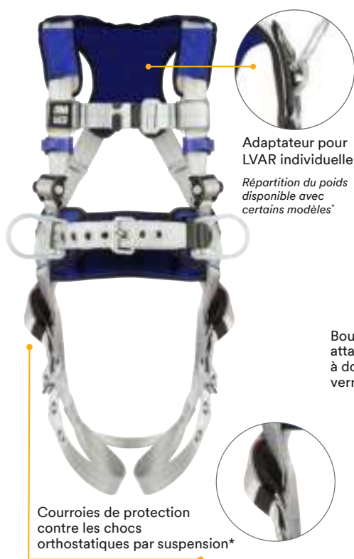
Harnais ExoFit MC DBI-SALA ® 3M MC de Série X100