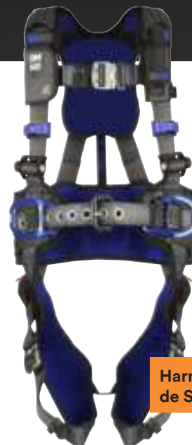
Harnais ExoFit MC de Série X300