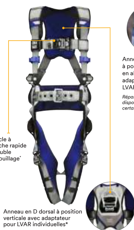
Harnais ExoFit MC DBI-SALA ® 3M MC de Série X200